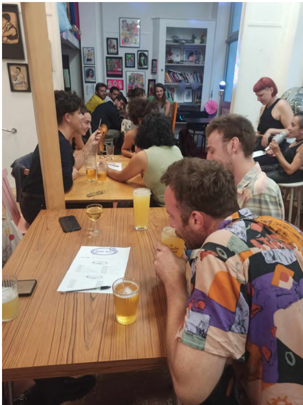
Time's Up géant, blind test et atelier Théâtre de L'Elysée et le Café Rosa, Lyon