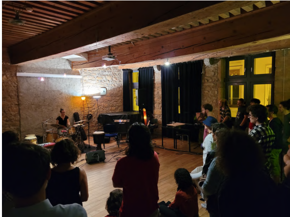
Projet musical "Contemporaines", Cefedem, Lyon