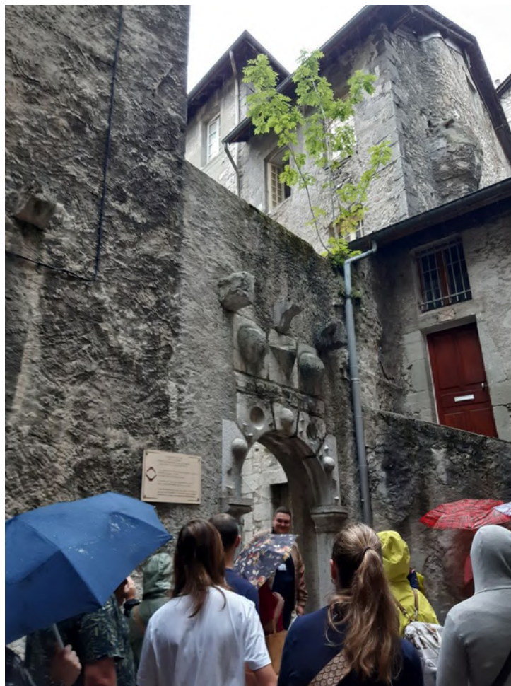
Visite guidée "Sur les traces des femmes résistantes en Savoie" Mairie de Chambéry