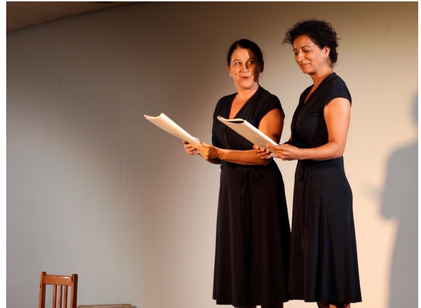
Spectacle "Je m'appelle Etty", médiathèque de Villeurbanne