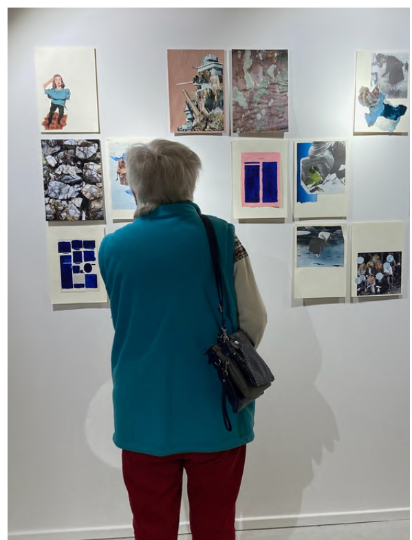
Exposition "Liebe Résistance", Musée de la Résistance du Vercors et le Matrimoine-en-Diois Vassieux-en-Vercors