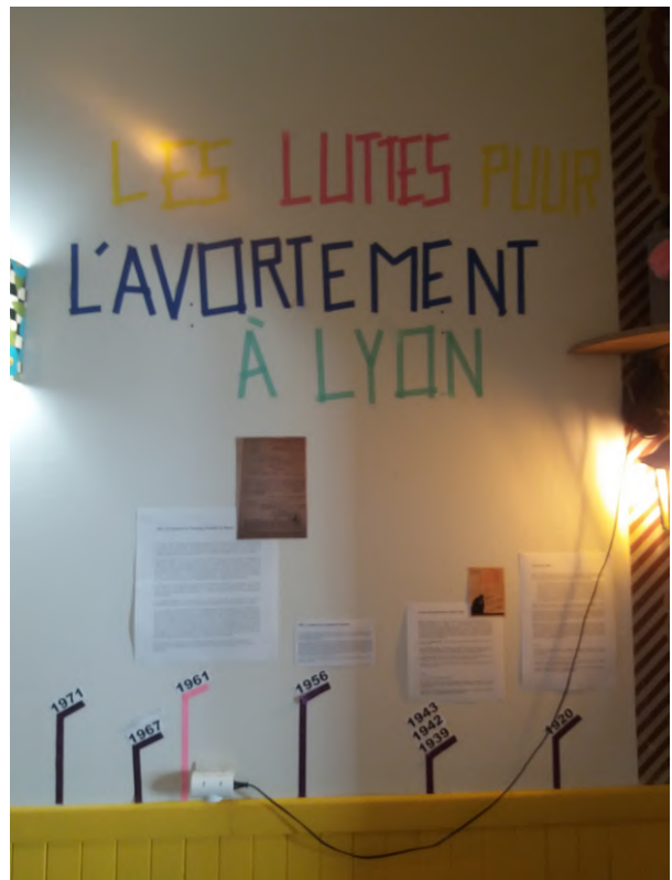
Exposition "Les luttes pour le droit à l'avortement à Lyon" Planning Familial 69, Lyon