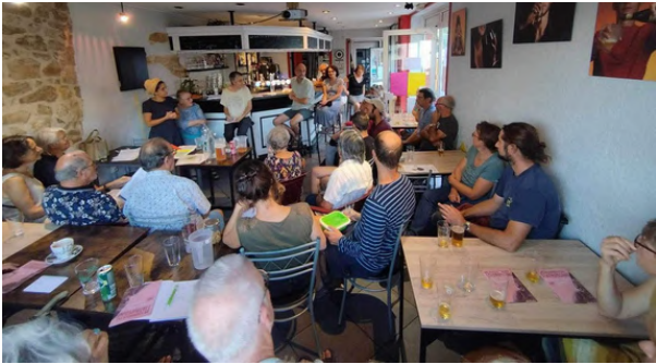
Rencontre et conférence "Qui était Odette Laguerre, féministe bugiste ?" Collectif Entre-autres, Artemare