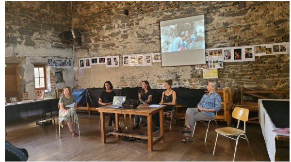
Table-ronde "Le matrimoine de la pierre en construction" Les Brayauds, Saint-Bonnet-près-Riom