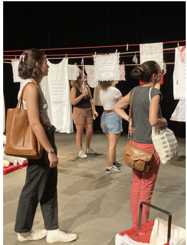
Installation et performance "43 coussins et une corde à linge, rêverie féministe" Rize de Villeurbanne et Si/si, Les femmes existent